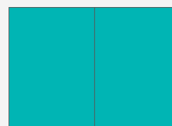
Umschlag U2 & S1